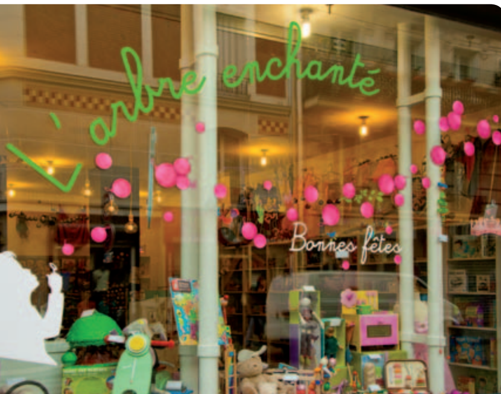
• L'arbre enchanté , magasin de jouets situé 40 rue du Château d'Eau