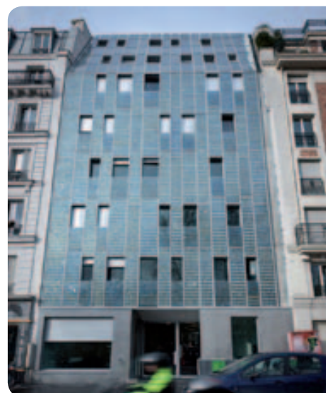
• Façade du 179 bis quai de Valmy, constituée de cellules photovoltaïques

Quant à la résidence sociale , elle constitue un complément d'offre de logement social. Sa vocation est de permettre aux personnes qui rencontrent momentanément des difficultés à se loger d'accéder à un logement autonome, pour une durée maximale de 2 ans.