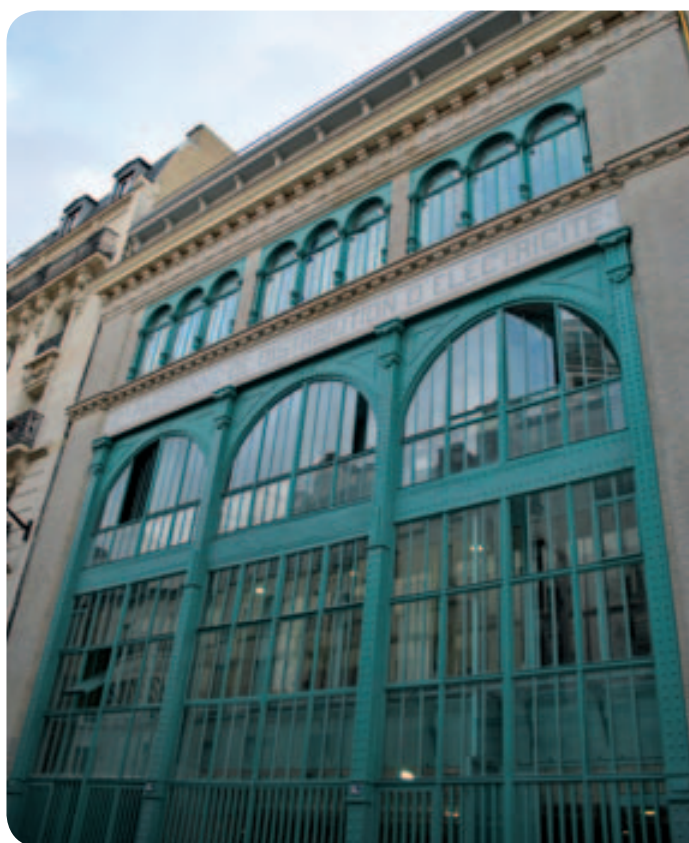
• Le bâtiment, construit en 1908, était à l'origine un transformateur électrique de la Compagnie du chemin de fer métropolitain de Paris.

Le centre Louvel-Tessier ne se singularise pas seulement par la qualité et l'esthétique des locaux. En effet, le projet social est innovant, mettant l'accent sur l'accès à la citoyenneté et sur la culture comme outil d'insertion. L'équipement du lieu ainsi que les activités doivent permettre aux occupants de se développer grâce à la culture, en organisant des activités dans les locaux (un espace culturel a été aménagé au rez-de-chaussée, animé par une chargée de mission), ou des sorties dans les musées, conservatoires, cinémas parisiens. Autre originalité, le CHU a une volonté affirmée de s'ouvrir au quartier et de participer à la vie locale, et de développer des partenariats avec les institutions culturelles et les associations du 10 e . Le centre Louvel-Tessier doit être plus qu'un lieu de vie : un espace public et citoyen.