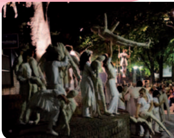
• Le Cri du poète , déambulation artistique proposée par la compagnie Bouche à Bouche lors de la Nuit blanche du 1 er octobre

Piloté par Alain Lhostis, élu délégué à la politique de la ville dans le 10 e , le projet a donné