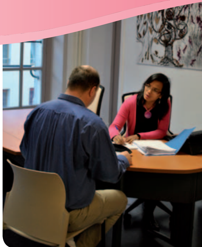
• Un habitant du 10 e est accueilli au nouveau Relais Information Familles